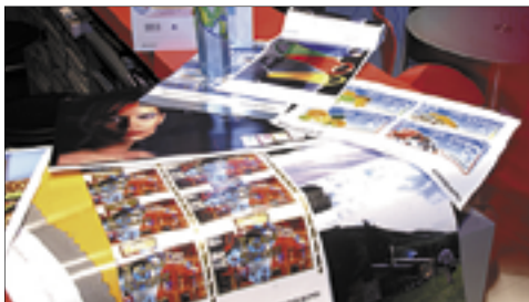
Abb. 4: Heidelberger Druckmaschinen AG

So arbeiten Layout- und EDV-Fachleute Hand in Hand.