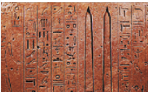
Abb. 1: Relief, Ägypten um 1500 v. Chr.