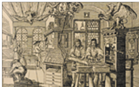
Abb. 2: Druckwerkstatt, Deutschland um 1650