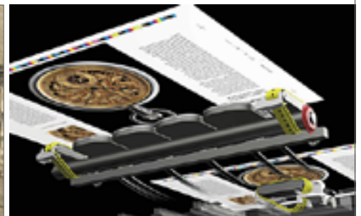
Abb. 3: Heidelberger Druckmaschinen AG